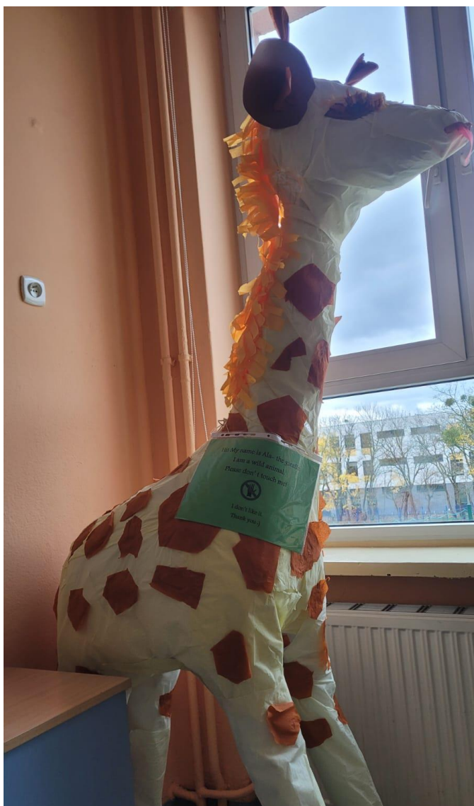
Model 3D - żyrafa Ala